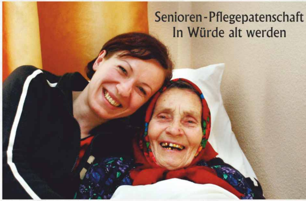
Senioren-Pflegepatenschaft In Würde alt werden